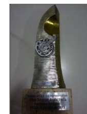
Mayor proyección 2007 Labor benéfica 2012 Más representativo 2013